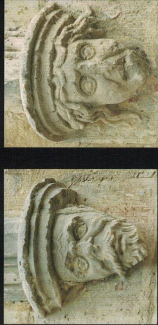
Caps de la portada de l'església. Cabezas de la portada de la iglesia.

L'ermita de Sant Pau conté, al seu interior, interessants frescos barrocs de la cúpula realitzats, tal i com mostra la seua firma, per Vicent Guilló , l'any 1690.