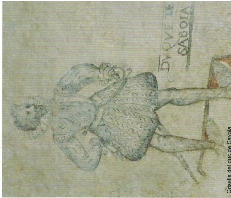
Grisalla del duc de Savoia